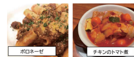
▲令和3年度にコラボレーションした2店のメニュー

令和3年度は、令和元年度に港区商店グランプリの港区議会議長賞を受賞した「La Goccia Tokyo」、令和2年度に港区長賞を獲得した「びのぐら〜ちえ」に、お店自慢のメニューから学校給食用のレシピを学校栄養士と連携して作成していただきました。令和4年度は、各地区のブロック長様、会長様にお声がけいただき、上記の飲食店の推薦をいただきました。