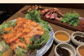
▲お店イチオシの三昧の鮭ローストと白金豚のロースト

港区商店グランプリで港区長賞を受賞した「暁タッパス芝大門《ピアロバタ》」は、昨年4月にオープンしたばかり。ランチは東北・釜石で作られた粕漬の魚を使ったヘルシーなお魚ワンプレートランチと日替わりカレーが共に好評、オープンから満席となるほどの人気です。一方、ディナーは落ち着いた雰囲気か魅力的。店内の奥にある囲炉裏で時間をかけてじっくりと炭火で焼き上げた『岩魚の炭火焼き』はふっくらジューシー、特におすすめの一品です。他にも、花巻の『白金豚』や福島の『伊達鶏』を使ったロースト料理も是非とも味わっていただきたいお料理です。