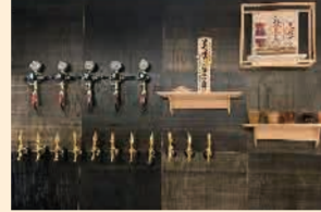
▲カウンター奥にビールサーバーがずらり

港区商店グランプリで港区長賞を受賞した「暁タッパス芝大門《ピアロバタ》」は、昨年4月にオープンしたばかり。ランチは東北・釜石で作られた粕漬の魚を使ったヘルシーなお魚ワンプレートランチと日替わりカレーが共に好評、オープンから満席となるほどの人気です。一方、ディナーは落ち着いた雰囲気か魅力的。店内の奥にある囲炉裏で時間をかけてじっくりと炭火で焼き上げた『岩魚の炭火焼き』はふっくらジューシー、特におすすめの一品です。他にも、花巻の『白金豚』や福島の『伊達鶏』を使ったロースト料理も是非とも味わっていただきたいお料理です。