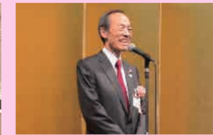
▲武井区長のご挨拶

▲多くのご来賓や商店街関係者で賑わいました 1月29日(水)に東京プリンスホテルにて、港区商店街連合会の新年賀詞交歓会及び港区商店グランプリ表彰式が行われ、多くの商店街関係者とともに新年の門出を祝いました。