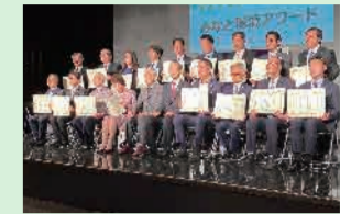
▲受賞者全員で記念撮影

▲左から竹内副会長、武井区長、鈴木部長、佐伯さん(武井区長を除きすべて青山表参道商店会) このたび「港区環境美化の推進及び喫煙による迷惑の防止に関する条例」に基づき、特色のある取り組みを実践している団体として青山表参道商店会が「環境美化・みなとタバコルール賞」を受賞しました。2/4(火)にみなとパーク芝浦にて表彰式が開催され、武井雅昭港区長より表彰状と盾が授与されました。