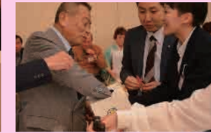
▲三角くじ抽選会の様子

港区商店グランプリ表彰式では、7のエントリー店が表彰され、港区長賞には、芝神明商店会の「暁タッパス芝大門《ピアロバタ》」が選ばれました(港区商店グランプリについては裏表紙参照)。また新年賀詞交歓会終盤に行われたお楽しみ三角くじ抽選会では、東京プリンスホテルのお食事券、スマイル商品券、いろいろなグッズが入ったJ:COM賞など、素敵な賞品が多くの方々に当たりました。