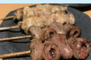
▲希少な部位の取り揃えられている焼き物

人気の理由は、食材へのこだわりとコストパフォーマンスの高さではないでしょうか。焼鳥に使用する鶏肉は、部位やメニューによって仕入れる産地が異なり、北は北海道から南は鹿児島と日本全国の様々な鶏肉を使用しています。また、通常は立地の問題から、価格が高騰してしまう青山でリーズナブルな価格で楽しめることもリピーターを増やしている理由でしょう。