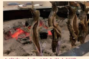
▲店内の中央で目を引くが端

▲自家醸造のクラフトビール『暁ビール』 港区商店グランプリで港区長賞を受賞した「暁タッパス芝大門《ピアロバタ》」は、昨年4月にオープンしたばかり。ランチは東北・釜石で作られた粕漬の魚を使ったヘルシーなお魚ワンプレートランチと日替わりカレーが共に好評、オープンから満席となるほどの人気です。一方、ディナーは落ち着いた雰囲気か魅力的。店内の奥にある囲炉裏で時間をかけてじっくりと炭火で焼き上げた『岩魚の炭火焼き』はふっくらジューシー、特におすすめの一品です。他にも、花巻の『白金豚』や福島の『伊達鶏』を使ったロースト料理も是非とも味わっていただきたいお料理です。