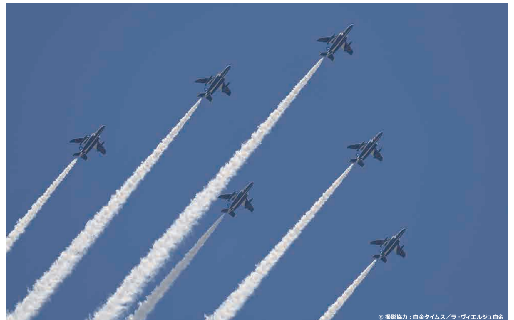
◎ 撮影協力: 白金タイムス/ラ・ヴィエルジュ白金

【発行・編集】港区商店街連合会 【発行人】須永 達雄 【所在地】港区芝公園1-5-25 港区役所3階 【電話】3578-2555